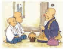
2年 A Pot of Poison