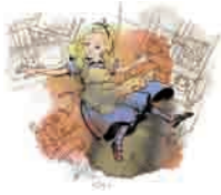
1年 Alice and Humpty Dumpty