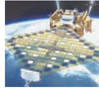
3年 Learning from Nature