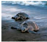
2年 Costa Rica