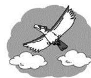
fly in the sky