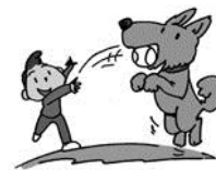
catch a ball

Step3 他の特徴を書いてみよう。(色や体の特徴など。can/can't を使ってもいいよ)