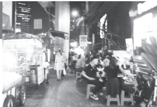
バンコクでは屋台で本格的な夕食が食べられる。帰宅前の人でいっぱいだ。

例えば、男性が言う場合の「ありがとう」はタイ語では “khop khun khrap” (khrap は男性が使う終助詞で、丁寧の「です・ます」に相当する) だが、これは低平調から中平調へ、さらに高平調へと、階段状に音階が高くなっていく。女性が言う場合は、 “khop khun khaa” (khaa は女性が使う丁寧形の終助詞) と、低平調から中平調へと上がってから、最後の単語 (khaa) で下