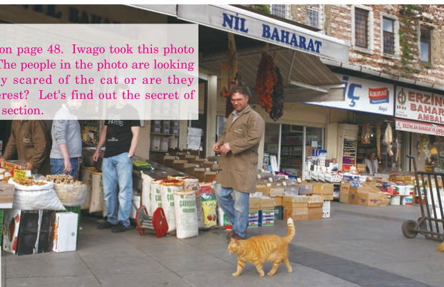
岩合さんが撮影したイスタンブールの街を歩くネコ a cat walking in Istanbul, Turkey