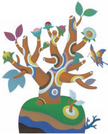
三年資料編「表とグラフによる効果」