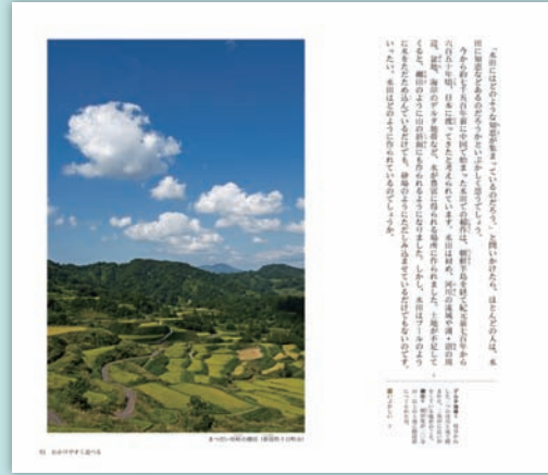
一年本編「水田のしくみを探る」